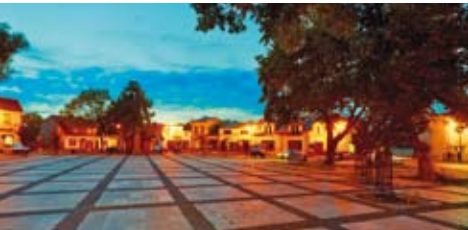
Rynek w Mstowie nocą