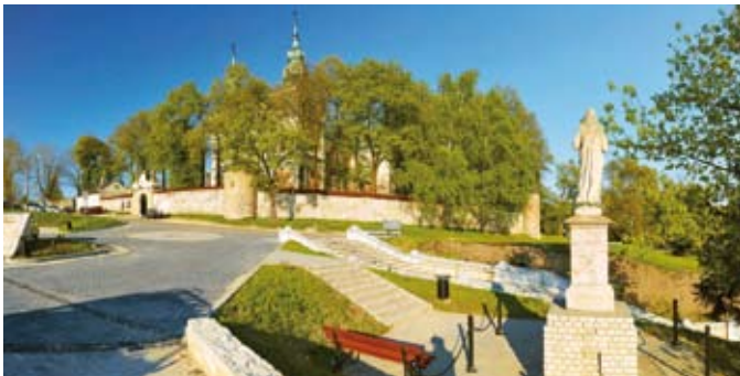
Klasztor urzeka swoim urokiem