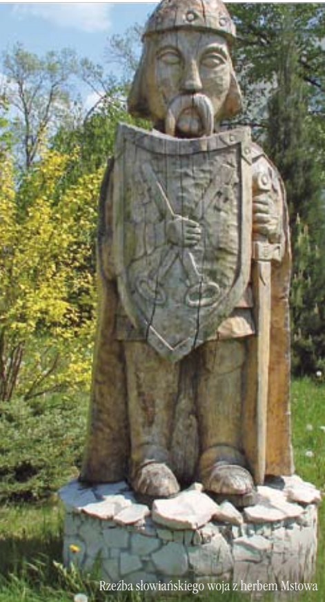
Rzeźba słowiańskiego woja z herbem Mstowa

D zięki lasom bogatym w zwierzyinę i dobrej ziemi pod uprawy, tutejsze okolice szybko stały się atrakcyjne do prowadzenia osiadłego trybu życia. Pierwsze ślady osadnictwa w Mstowie i jego okolicach sięgają epoki górnego paleolitu, czyli ok. 12 tysięcy lat temu.