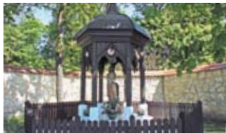
Drewniana kapliczka w Małusach Wielkich