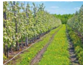
Wizytówką gminy są sady jabłoniowe

W gminie Mstów działa ponad 600 podmiotów gospodarczych. Do największych prac-