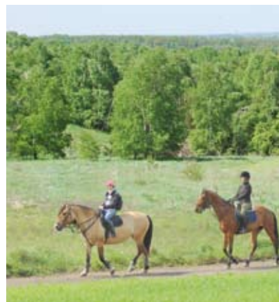
U podnóża Przeprósnej Góry

grają tu trampkarze, juniorzy i seniorzy. Dzięki wsparciu wielu instytucji i osób prywatnych dostarcza on dużo radości mieszkańcom gminy. Obecnie jego zespół seniorów występuje