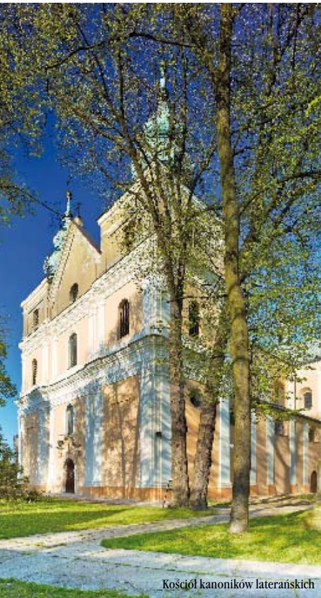
Kościół kanoników laterańskich

P oczątki zakonu kanoników regularnych laterańskich sięgają IV-V w. W średniowieczu posiadał on ponad 2,5 tys. klasztorów. Na terenie Polski kanonicy mieli swe obiekty m.in. w Krakowie, Czerwińsku i Wrocławiu. Wkrótce filią tego ostatniego stał się zespół klasztorny w Mstowie (Wancerzowie). Wzniesiono go na lewym brzegu Warty i obdarowano licznymi przywilejami (1220 r.).