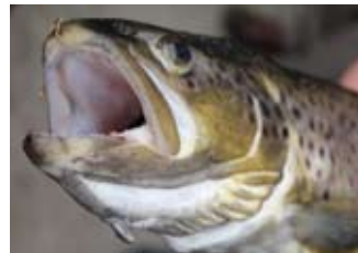
Pstrąg potokowy złowiony w Warcie

Dumą Mstowa jest liczący ponad sześćdziesiąt lat klub LKS Warta Mstów. W piłkę nożną