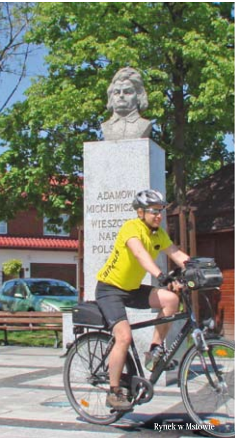
Rynek w Mstowie

W gminie Mstów nie brakuje turystycznych atrakcji. Są tu ciekawe zabytki świeckie i sakralne, pomniki przyrody, liczne szlaki piesze i rowerowe, tereny spacerowe oraz doskonałe miejsca do wędkowania.