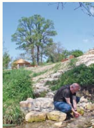
Jedno ze źródeł pod Skalą Miłości

Na północ od Mstowa, obok wsi Latosówka i Cegielnia, znajduje się spory kamieniołom wapienia. Należy on do zakładu górniczego „Latosówka”. Wejście na teren kopalni odkrywkowej jest możliwe wyłącznie dla grup zorganizowanych (max. 25 osób) po uprzednim uzgodnieniu (tel. 34 321 01 18). Kopalnia jest udostępniana zwiedzającym raz w miesiącu. Jeżeli ktoś chce poczuć klimat prawdziwego wiejskiego jarmarku, to koniecznie powinien odwiedzić Cegielnę. W poniedziałki handluje się tutaj płodami rolnymi. Stąd niedaleko już do Kłobukowic, gdzie znajdziemy zabytkowy park z lipami, kasztanowcami i jaworami (10 ha). W jego otoczeniu stoi neogotycki pałac z XIX w. oraz XVIII-wieczny spichlerz i budynek dla służby dworskiej. Przed ▶