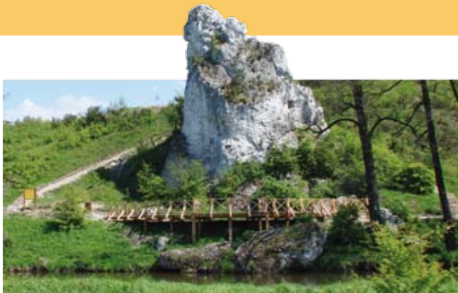
Skala Miłości z platformą widokową

widok na okolicę. Przy granicy gminy Mstów z Częstochową, na stromym zboczu wapiennego wzgórza Przepróśnej Górki, znajduje się kilka hektarów płata subkontynentalnego lasu grądowego. Nie brakuje tu lipy szerokolistnej, grabów, dębów szypułkowych czy klonów zwyczajnych. W poszyciu znaleźć można groszek wiosenny, miodunkę, gajowiec żółty lub czarniec gronkowy. Na szczytcie