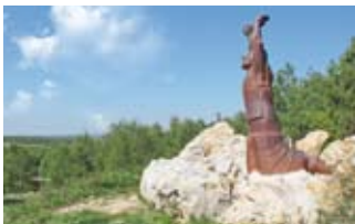
Przepróśna Górka w Siedlcu

widok na okolicę. Przy granicy gminy Mstów z Częstochową, na stromym zboczu wapiennego wzgórza Przepróśnej Górki, znajduje się kilka hektarów płata subkontynentalnego lasu grądowego. Nie brakuje tu lipy szerokolistnej, grabów, dębów szypułkowych czy klonów zwyczajnych. W poszyciu znaleźć można groszek wiosenny, miodunkę, gajowiec żółty lub czarniec gronkowy. Na szczytcie