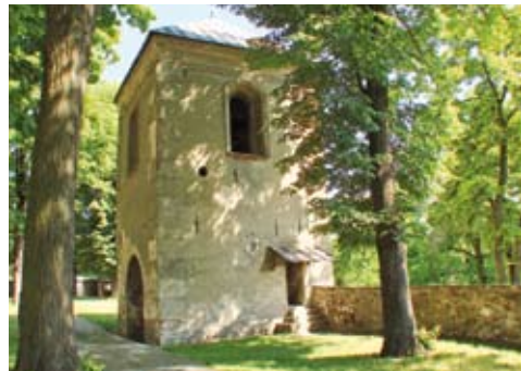
Dzwonnica/dawny budynek bramny od zachodu

Wzgórze klasztorne chronił kamienny mur z dziesięcioma basztami. Pięć baszt ze strzelnicami wzniesiono w jego narożnikach, po dwie od strony