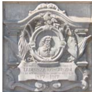
Tablica poświęcona T. Kościuszcze w Mstowie

Podczas drugiego rozbioru Polski Mstów został podzielony między zabór rosyjski i pruski, co spowodowało jego dalszy upadek. Na początku XIX w. próbowano jeszcze podnieść znaczenie Mstowa. Powstały manufaktury włókiennicze. Jednak miasto nie odzyskało dawnej świetności. W 1863 r. miejscowa ludność masowo przyłączyła się do powstania styczniowego. Po jego porażce,