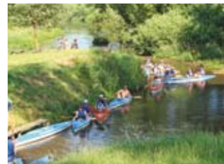
Zakole Warty w Mstowie

Warty w gminie Mstów zyskuje coraz większe uznanie kajakarzy. Część popularnych spływów rozpoczyna się przy Bramie Mirowskiej i kończy w Mstowie, na wysokości zbiornika Tasarki. Płynąc rzeką w kierunku Jaskrowa, mijamy m.in. wzgórze – Przeprósną Górkę z Sanktuarium św. Ojca Pio oraz tajemnicze wzgórze Gąszczyk ze śladami dawnego grodziska. Za mostem w Jaskrowie Warta biegnie już naturalnym korytem, coraz bardziej meandruje. Wpływając do Mstowa, po lewej stronie mamy Dobrą Górę. Po prawej, na wzniesieniu zobaczymy zespół starych stodół. Niebawem naszym oczom ukaże się klasztor warowny zakonu kanoników regularnych laterańskich, a następnie Skała Miłości. Trasa spływu nie