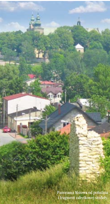
Panorama Mstowa od południa i fragment zabytkowej stodoły.

K rajobraz gminy wpisany w dolinę rzeki Warty zaskakuje swoim urokiem. To tędy przed wiekami biegł ważny trakt handlowy z Krakowa do Wrocławia o nazwie strata magna. Dał on początek dawnemu miastu Mstów z przeprawą rzeczną i komorami celnymi. Dziś malownicze tereny Warty przyciągają coraz więcej turystów pieszych, wędkarzy i kajakarzy.