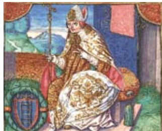
Henryk Kietlicz, arcybiskup gnieźnieński

Łagodne wzniesienia z szachownicą pól, łąk i lasów oraz płynąca pomiędzy nimi Warta to turystyczny raj dla miłośników pieszych i rowerowych wędrowek, rajdów konnych i spływów kajakowych. Ponad 60% obszaru gminy leży w granicach i otulinie Parku Krajobrazowego „Orlich Gniazd”. Na jej terenie znajduje się sześć pomników przyrody. Najokazalszy jest dąb szypułkowy przy ul. Wolności w Mstowie. Natomiast przy ul. 16 Stycznia stoją cztery dorodne cisy pospolite. W Małusach Wielkich w parku podworskim podziwiać