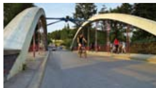
Most nad Wartą w Mstowie

Tylko dla grup zorganizowanych (do 25 osób) po uprzednim uzgodnieniu. Kopalnia jest udostępniana zwiedzającym raz w miesiącu. tel. 34 321 01 18