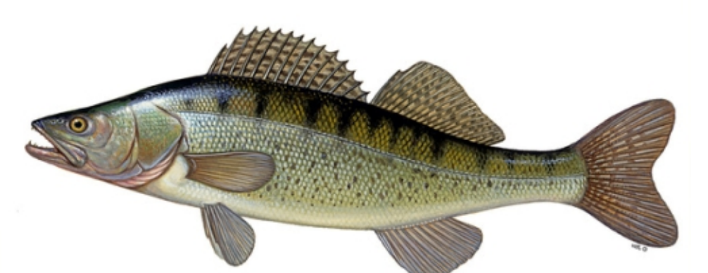
Sandacz (łac. Sander lucioperca ) Wymiar ochronny do 50 cm i powyżej 70 cm / 2 szt. Okres ochronny od 1.01 do 31.05