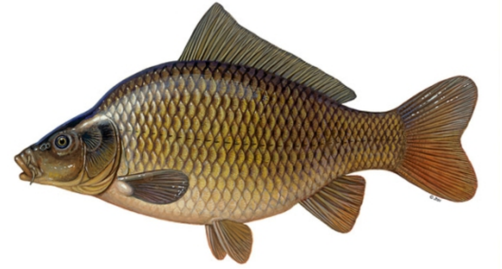
Karp (łac. Cyprinus carpio ) Wymiar ochronny do 35 cm / 2 szt.

Wymiary i okresy ochronne najważniejszych gatunków występujących w zbiorniku: