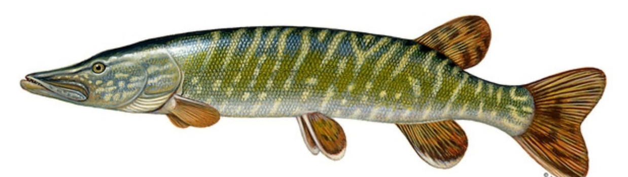
Szczupak (łac. Esox lucius ) Wymiar ochronny do 50 cm i powyżej 70 cm / 2 szt. Okres ochronny od 1.01 do 30.04