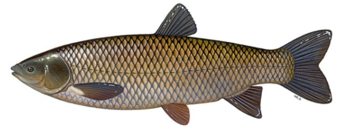
Amur biały (łac. Ctenopharyngodon idella ) Wymiar ochronny do 50 cm / 1 szt.