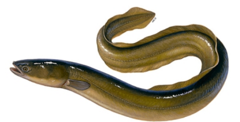
Węgorz (łac. Anguilla anguilla ) Wymiar ochronny do 50 cm / 1 szt.