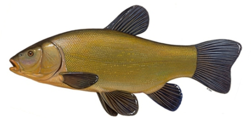
Lin (łac. Tinca tinca ) Wymiar ochronny do 30 cm / 2 szt.