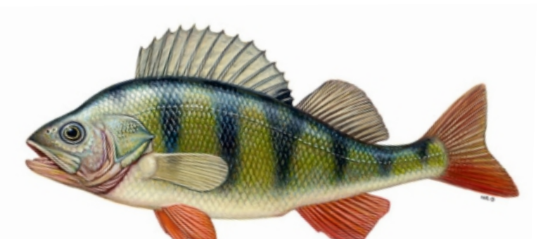
Okoń (łac. Perca fluviatilis ) Wymiar ochronny do 18 cm / 10 szt.