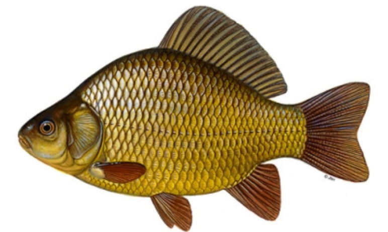
Karasz pospolity (łac. Carassius carassius ) Całkowity zakaz połowu.